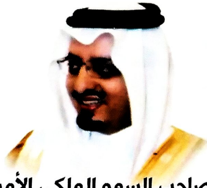
صاحب السمو الملكي الأمير فيصل بن خالد بن عبدالعزيز أمير منطقة عسير