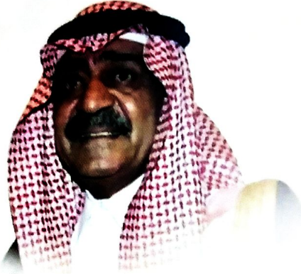
صاحب السمو الملكي الأمير مقرن بن عبدالعزيز آل سعود ولي ولي العهد