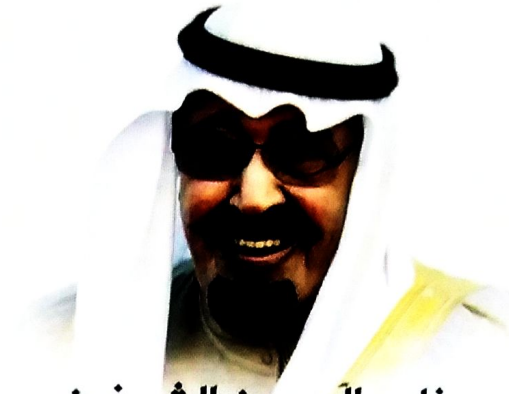
خادم الحرمين الشريفين عبدالله بن عبدالعزيز آل سعود