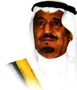
ولي العهد الأمين الأمير سلمان بن عبدالعزيز آل سعود